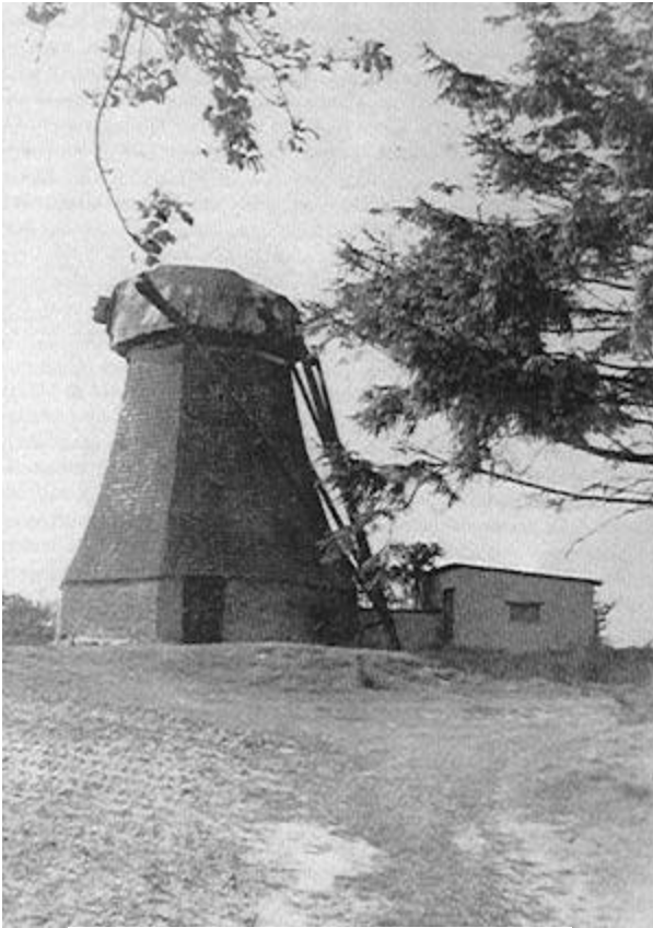
Die Hilter Mühle: vor ihrer Renovierung