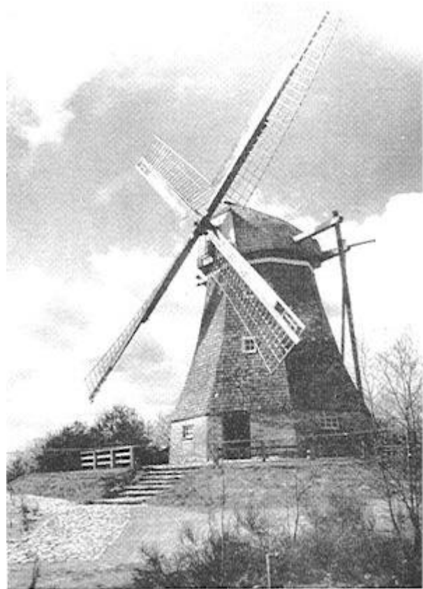
Die Hilter Mühle: nach ihrer Renovierung

Aber das scheinbar unabwendbare Mühlenschicksal unseres Jahrhunderts ging noch einmal an ihr vorüber. Die Mühle, die inzwischen schon fast 150 Jahre auf ihrem hölzernen Buckel hatte, wurde vor einigen Jahren „entdeckt“ und konnte schließlich 1964 im Auftrage des Heimatvereins für den Kreis Aschendorf-Hümmling renoviert werden. Mit der Hilter Mühle hatte der Kreisheimatverein die zweite Mühle im nördlichen Emsland vor dem totalen Verfall gerettet. Schon 1957 konnte man die in Niedersachsen einmalige kombinierte Wind- und Wassermühle bei Hüven renovieren. (Eine weitere Mühle dieser Art gab es früher nur noch in Herßum im Kreise Meppen).